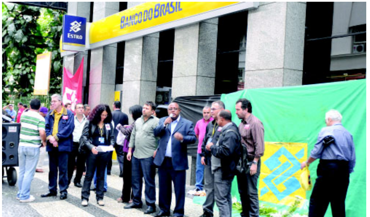
Os bancários jogaram flores sobre o símbolo do Banco do Brasil. O protesto contou com o apoio da população. Os funcionários estão indignados com o aumento do assédio moral no banco

O Sindicato realizou nova manifestação contra a prática de assédio moral e os descomissionamentos no Banco do Brasil na última terça-feira, dia 10, em frente à unidade da Rua Senador Dantas, 105. Para convocar os bancários a participarem do ato, os sindicalistas panfletaram na porta e nos andares do prédio do Sedan. A mobilização surtiu efeito. Na quarta-feira (11), a direção do banco participou de uma negociação, na sede do Sindicato, para debater o problema.