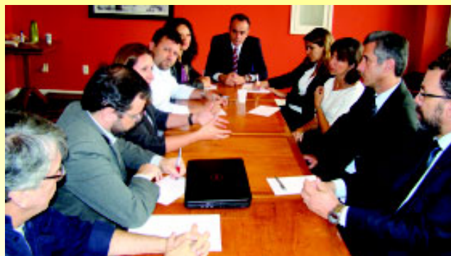
O Sindicato cobrou o fim do assédio moral no BB

“Caso o banco não ponha fim a essas práticas e continue a aterrorizar os funcionários, vamos intensificar a mobilização e,