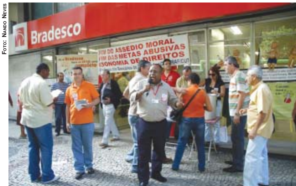
SINDICATO NAS AGÊNCIAS - O Sindicato realiza uma campanha permanente pelo fim do assédio moral e das metas abusivas. Na terça-feira (9) haverá caravana em Madureira, em mais uma atividade da campanha salarial

Os bancários reafirmaram que o assédio moral e a violência organizacional são uns dos principais problemas enfrentados hoje pela categoria nos locais de trabalho. "As metas abusivas